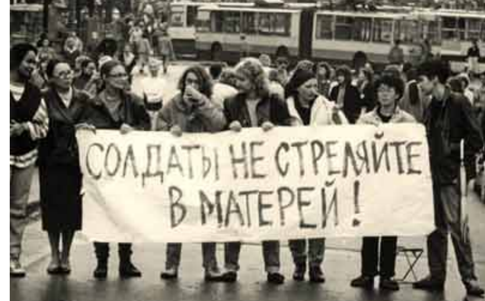
1991 год. Москва. Демонстрация против войны в Чечне.