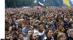
1991 год. Москва. Демонстрация на улицах Москвы. - 6