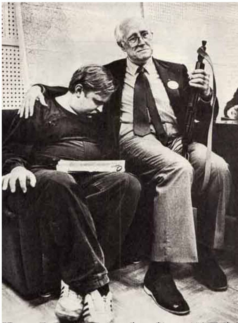
М.Ростропович в Белом доме дает интервью Владиславу Листьеву М.Ростропович в Белом доме дает интервью Владиславу Листьеву