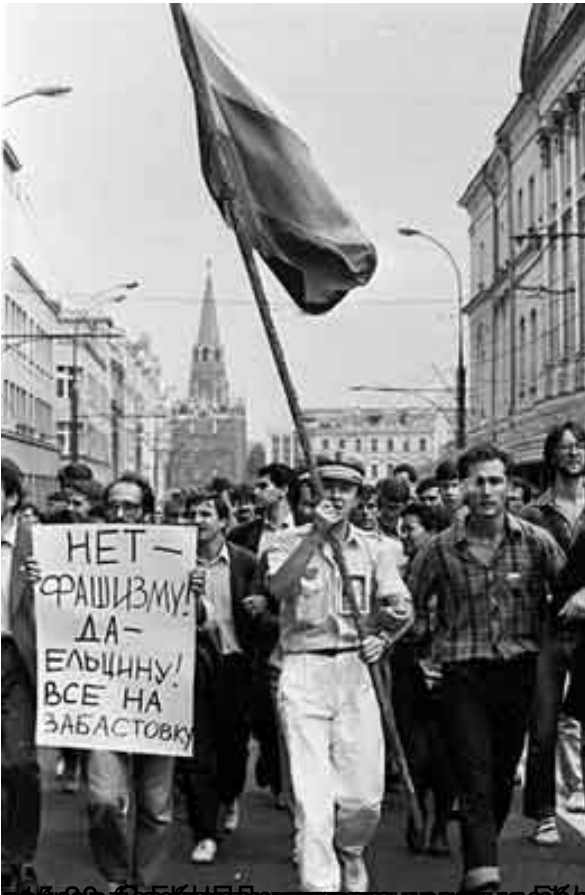
1990-е годы. Москва. Демонстрация против фашизма и в поддержку Ельцина. - 6