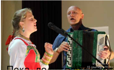
Пока поют, танцуют и гуляют под зонтом воздуха